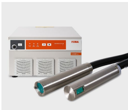
FOBA Titus™ ist der kleinste Lasermarkierkopf auf dem Markt und eignet sich für die hochflexible Integration in Fertigungslinien.

Weitere Informationen sowie Text- und Bildmaterial erhalten Sie von: For additional information and images for editorial use please contact: